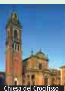
Chiesa del Crocifisso

Comincia nella parrocchia di Castel San Pietro la preparazione alla festa del Crocifisso, che si terrà nella quinta domenica di Quaresima, il 10 aprile. In tutti i venerdì di