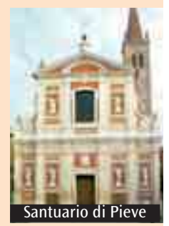
Santuario di Pieve

particolare significato religioso ed erano festivi, senza però essere in relazione con la devozione al Crocifisso. Dopo che nella seconda metà del Settecento prese forza il culto del Crocifisso, questi giorni vennero scelti per le cerimonie più solenni. I «Venerdì di marzo» sono ancora una viva tradizione religiosa, con la partecipazione di numerosi pellegrini da altri paesi e città. Le parrocchie del vicariato di Cento e di altri vicariati svolgono una stazione quaresimale al Santuario del Crocifisso. Numerosi ex-voto testimoniano i fatti prodigiosi avvenuti per l'invocazione al Crocifisso.