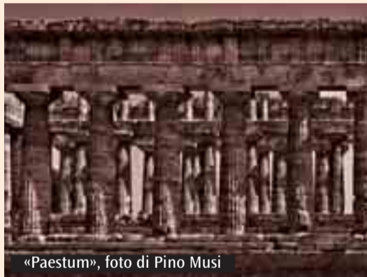
«Paestum», foto di Pino Musi

È stato presentato a Roma il volume Fmr «Italia. Bellezza eterna», un progetto artistico, culturale ed editoriale nato per celebrare l'Italia nei 150 anni della sua unità. Il volume, composto di 418 pagine nel formato chiuso di cm 31x43x6, rappresenta un viaggio ideale attraverso alcuni dei massimi capolavori dell'arte antica presenti in Italia e si fonda su uno straordinario corpus d'immagini d'autore e seguite da Pino Musi in esclusiva per Fmr. L'opera è stata ideata dalla Fondazione Fmr-Marilena Ferrari, ed è realizzata in tiratura limitata a duemila esemplari dalla casa editrice d'arte Fmr. La parte iconografica è costituita da 137 fotografie originali relative a Colosseo, Fori Imperiali, Pantheon e Appia Antica a Roma; Villa Adriana a Tivoli, Cerveteri, Paestum, Pompei, Agrigento e Siracusa. Tutte le immagini sono stampate a piena pagina su carta speciale patinata opaca da 170 grammi, prodotta dalla Cartiera del Garda. La parte testuale, stampata anch'essa sulla stessa carta speciale, comprende testi di Louis Godart, direttore scientifico dell'opera; una prefazione di Marilena Ferrari, presidente della casa editrice d'arte Fmr; una riflessione di Pino Musi sulle opere fotografiche e una selezione di testi brevi di autori del passato. Nel Palazzo Nuovo in Campidoglio a Roma è stata allestita la mostra «Italia. Bellezza eterna» con le opere fotografiche di Pino Musi, tratte dal volume, che resterà aperta fino al 20 marzo (ingresso libero).