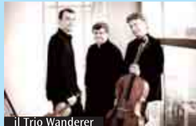
il Trio Wanderer