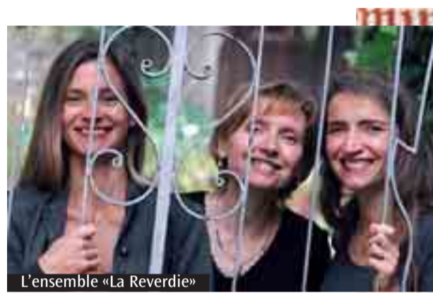
L'ensemble «La Reverdie»