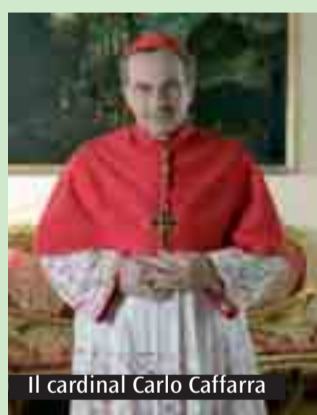
Il cardinal Carlo Caffarra

In occasione della celebrazione del 150° anniversario dell'unità d'Italia, giovedì 17 marzo, il cardinale Carlo Caffarra presiederà una solenne Eucaristia alle 18.30 nella Basilica di San Petronio. Per consentire la più ampia partecipazione dei fedeli l'Arcivescovo ha disposto che in tale giornata sia sospesa la celebrazione delle Messe vespertine «intra moenia». La celebrazione sarà trasmessa in diretta da E-tv e Radio Nettuno.