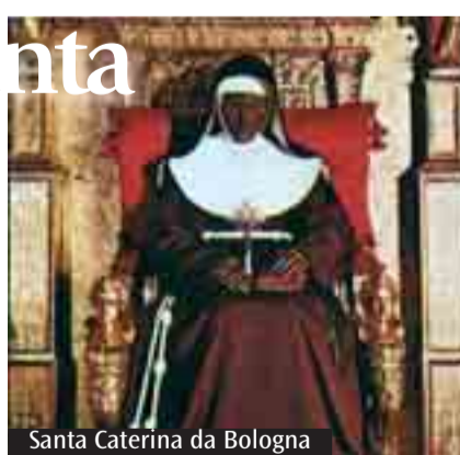
Santa Caterina da Bologna

poca specie di pane vi fosse tutta la divinità e l'umanità di Cristo e sentì e gustò la dolcezza della purissima carne dell'Immacolato Agnello Cristo Gesù». Caterina, ha detto il Cardinale, vive momenti forti di tentazione che durano anche anni e che le procurano grandi sofferenze, ma con il dono grande della preghiera rimane sempre ferma con fede davanti al Signore arrivando a dire per esperienza: «piacere e dispiacere mi siano uguali, l'importante è che io piaccia a Cristo mio». Santa Caterina dice che è la buona volontà l'«anello» che unisce l'anima al divino amore. In uno dei passaggi dell'omelia il Cardinale le fa eco dicendo che è il dono della fede che ci unisce a Dio nostro Padre e che ci permette questa relazione d'amore profonda e significativa con Lui. La città di Bologna, ha concluso l'Arcivescovo, ha bisogno della sua Santa, del suo magistero e ancor più della sua esperienza di vita. Ancora oggi ella è viva come esempio per noi, ma anche come madre che continua a generarci nella fede in quel grembo grande che è la Chiesa e in particolare la Chiesa in Bologna.