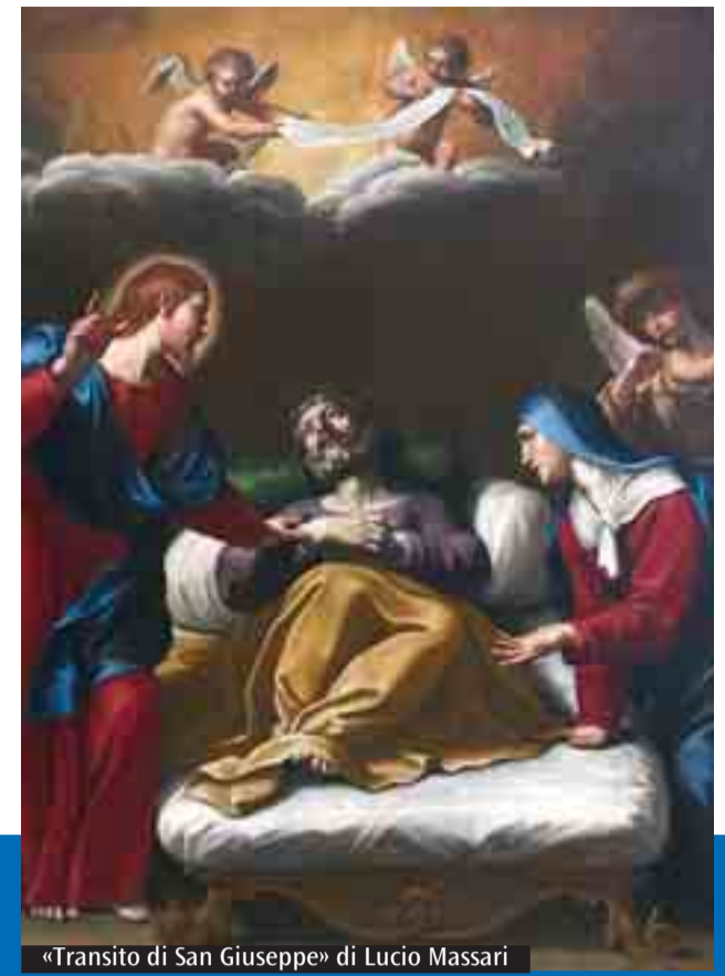
«Transito di San Giuseppe» di Lucio Massari

(1650 circa); «Dio Padre con San Francesco d'Assisi, Sant'Anna e Sant'Antonio abate» di ambito bolognese, 1684-1692 circa. Il restauro è stato effettuato con il contributo della Fondazione Cassa di Risparmio in Bologna. Ma, come ricorda il soprintendente Luigi Ficacci nell'introduzione al libro sul restauro, anche in questa occasione «la Soprintendenza, la Curia arcivescovile e la Fondazione Carisbo hanno operato in sintonia per perseguire il comune obiettivo di recuperare un importante patrimonio, ancora completamente inedito». «Il restauro di ben cinque dipinti nella chiesa di Trebbo di Reno - aggiunge monsignor Cavina sempre in apertura del libro - è un evento davvero importante per la parrocchia. Riportare le luci e i colori originari in queste opere d'arte ha permesso uno studio sulla loro provenienza, sulle attribuzioni e, in fondo, sulla storia di questa comunità cristiana. Poterli collocare nuovamente nella loro sede, dopo il restauro, consente a tutti di comprenderli nel loro autentico significato e stimola a rimettere in luce la vicenda di fede e di tradizione che, attraverso il tempo, ha lasciato segni importanti». Chiara Unguendoli