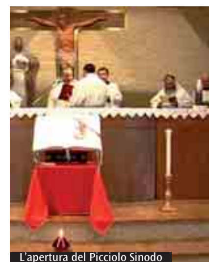
L'apertura del Piccolo Sinodo