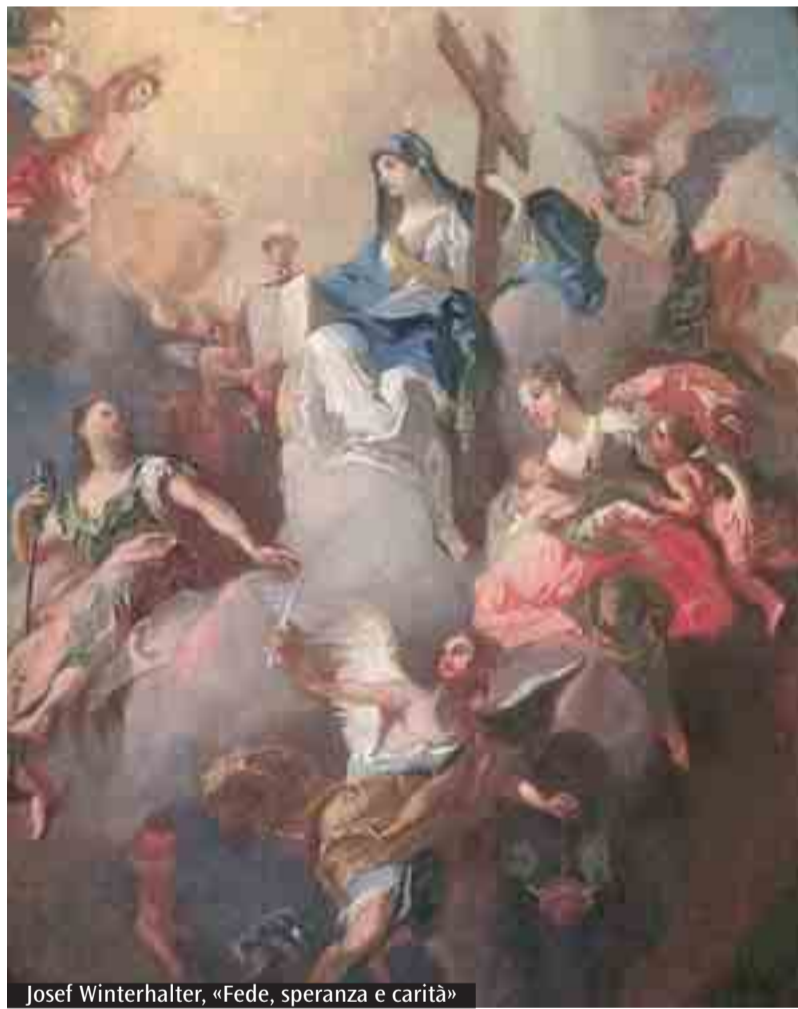
Josef Winterhalter, «Fede, speranza e carità»

Mi è piaciuto soprattutto l'invito del cardinale ai cattolici che hanno scoperto solo oggi le parti oscure del Risorgimento a non fermarsi a quello. E quindi ad amare la storia del nostro Paese e del nostro popolo. Anche perché veniamo da una storia repubblicana dove abbiamo avuto una parte fondamentale nel difendere l'identità del nostro popolo e il nostro destino di nazione. Fa impressione leggere le parole di Solovev, citate da Biffi, secondo il quale gli italiani sono stati tra i primi in Europa a raggiungere l'autocoscienza nazionale già a partire dal XII secolo. Come dire che san Francesco e Cimabue per l'unità del nostro paese sono più decisivi di Garibaldi e Cavour... Chiaramente lo sono. Se non ci fossero stati Francesco, Dante, Tommaso d'Aquino e compagnia bella non si sarebbe potuto parlare di Italia.